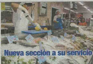
Nueva sección a su servicio

Supermercado: Ctra. de Salamanca, s/n Tel: 923 47 31 76 Fax: 923 48 75 92 Cash: c/ Wellington, s/n Tel: 923 48 77 17 FUENTES DE ONORO (Salamanca)