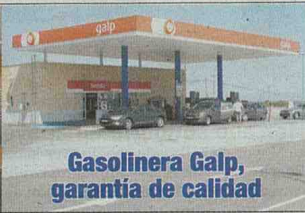
Gasolinera Galp, garantía de calidad