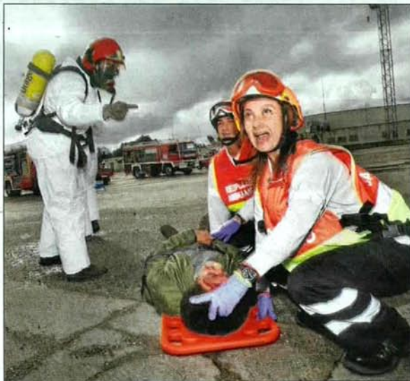
Los servicios de emergencia del 112 atienden a uno de los heridos.

En el simulacro, que incluía la activación del Plan Especial de Mercancías Peligrosas por parte de la Delegación Territorial de la Junta en Salamanca, han participado dos docenas de bomberos pertenecientes al Servicio de Extinción de Incendios de la Diputación de Salamanca y del Servicio Nacional de Bomberos de Portugal, así como personal facultativo de Sacyl y agentes de la Guardia Civil. ■