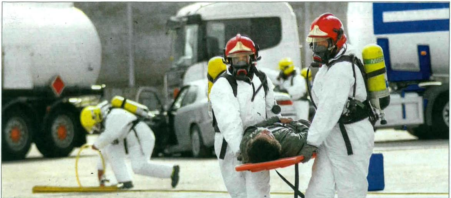
Uno de los heridos en el simulacro es evacuado en camilla por dos bomberos de Ciudad Rodrigo.