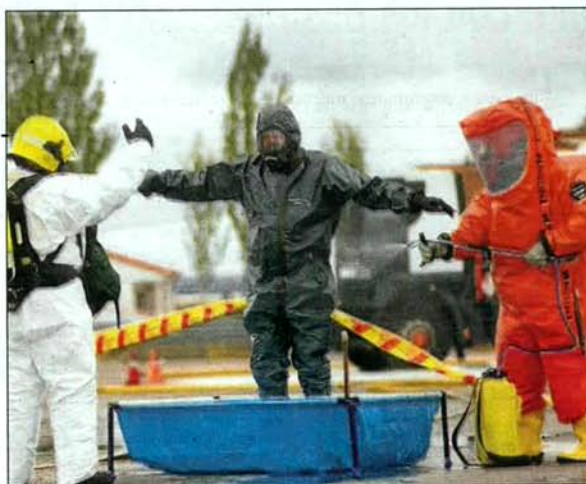
Un efectivo de la Guardia Civil se somete a un control preventivo.