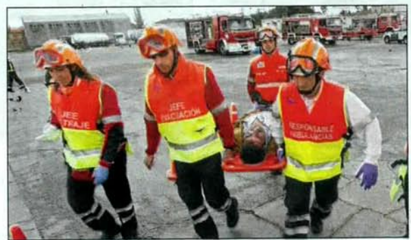
Varios miembros del equipo de emergencias traslada a otro de los heridos.