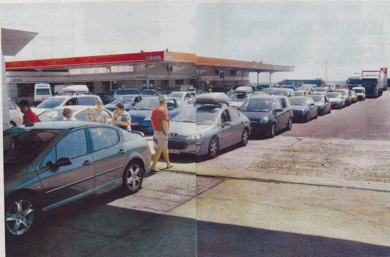
Retenciones en Fuentes de Oñoro, en la jornada de ayer.