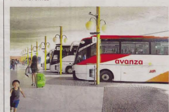
Autobuses de la compañía en la estación.