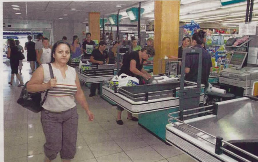
Muchos establecimientos de "Galerías Gildo" abren ininterrumpidamente durante los fines de semana.