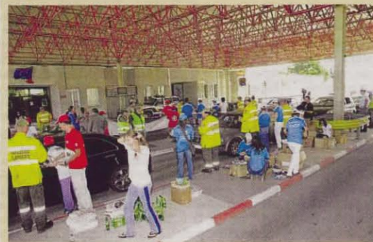
Reparto de agua en la frontera de Fuentes de Oñoro. Durante la jornada de ayer y coincidiendo con la Jornada de Prevención de Incendios que se celebra en Portugal se procedió al reparto de agua y materiales preventivos en las zonas fronterizas como Fuentes de Oñoro.