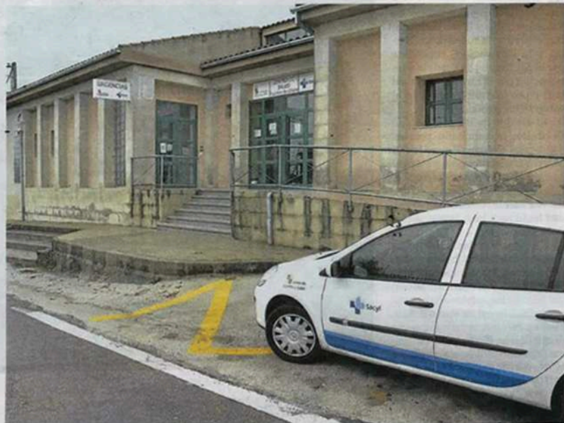
Los municipios atendidos por el centro médico de Fuentes de Oñoro piden que se instale una ambulancia.

Además, otra de las críticas que planteó el alcalde estuvo relacionada con el kilometraje de los vehículos sanitarios. Según señaló, "creemos que en algunos casos podría haber expirado ya el uso recomendado".