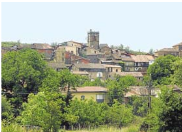
La iglesia de Cepeda donde se ha instalado la nueva iluminación.

De esta forma se concluye una nueva intervención en la zona de la carretera del Madroñal, donde se está construyendo el futuro polígono industrial de la villa.