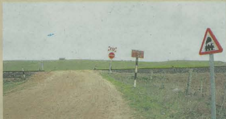
Siniestro en el de Martín de Yeltes. El 11 de abril de 2004 fallecieron seis jóvenes y dos resultaron heridos en este paso a nivel sin barreras de Martín de Yeltes. A pesar de haberse iniciado el proceso para suprimirlo, no han comenzado las obras.