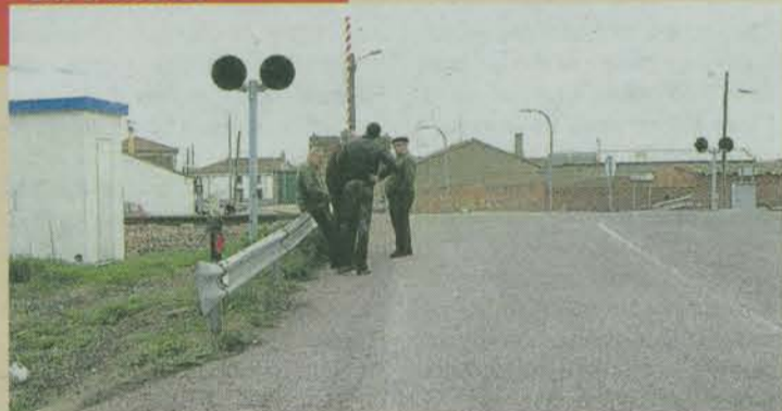
Parado el paso urbano de Gomecello. Mientras existes planes de supresión de dos pasos con caminos agrícolas en Gomecello, el del casco urbano sigue sin proyecto, a pesar de ser el que más preocupa al Ayuntamiento./ENE