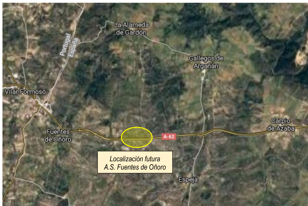
Plano de situación

En el procedimiento de licitación, como criterio de sostenibilidad ambiental se valorarán las propuestas que incluyan puntos de carga de vehículos eléctricos u otras fuentes alternativas de suministro de energía.